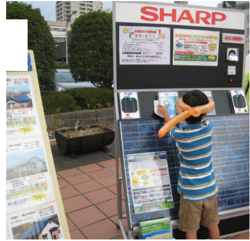
太陽光パネルを触るこども